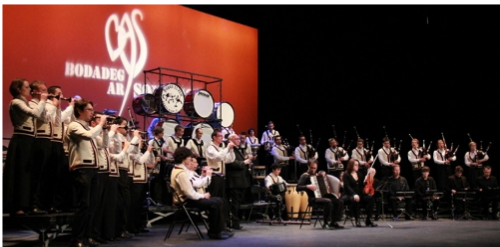
Le Bagad Elven sur la scène du Quartz, le 24 février 2013

Une musique de toutes les Bretagnes, puisant tout à la fois au plus profond de ses racines et dans une modernité la plus avancée !